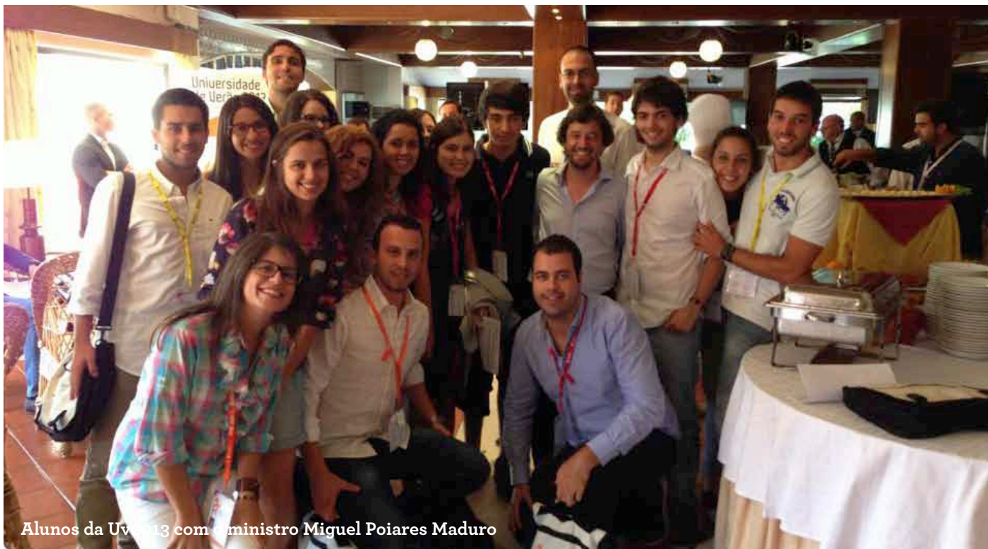
Alunos da UV 2013 com o ministro Miguel Poiares Maduro

“Actualmente, na Europa, entre hipóteses impossíveis temos de escolher as mais possíveis”